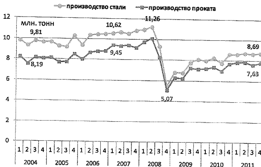
Рис. 1.2 Квартальная динамика производства стали и проката в Украине в 2004-2011

Большинству предприятиям металлургического комплекса в текущем году удалось достичь положительной динамики выплавки сырой стали по сравнению с прошлым годом, за исключением лишь четырех предприятий, в том числе АрселорМиттал (-430 тыс. тонн или -7,0%) и Донецкого МЗ (-135 тыс. тонн или -25,5%).